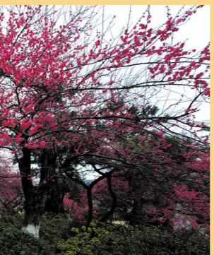
摄影作品:《春暖花开》作者:秦笃祥