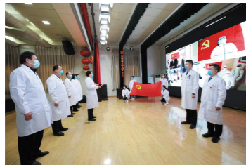
南湖摇篮罩光环,伟大共党开新元, 中华大地破竹势,粉碎封建千年制. 国共合作不欢颜,坚定信念不走偏, 农村包围城市妙,武装夺权道路好. 抗战英雄藏功名,只为党旗那片红,

百年大党,百年风霜,民心所向,共铸辉煌。站在百年的新起点上,我院全院党员干部将以时不我待的使命感,只争朝夕的紧迫感,未雨绸缪的危机感,伟大时代的归属感,不负韶华、砥砺前行,在平凡的岗位上把本职工作做好做实,用实际行动向共产党百年华诞献礼!