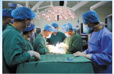
治重病,足不出户就能享受到国家级名医的医疗服务。(冯晓丽)

业务骨干到上海复旦大学附属肿瘤医院学习外科手术管理与技能,助推了学科的发展,打造出医院高素质人才新高地。医院还通过名院进修、名医会诊、医联体建设等多种模式,将优质医疗资源下沉。在国内、省知名专家的指导和传帮带下,医疗技术、科研、人才培养等方面不断提升,学科优势与特色日益凸显,让水城百姓真正在家门口治大病、