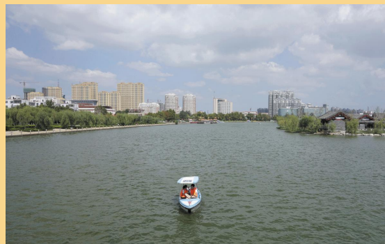
摄影作品:《春暖花开》 作者:周宪林