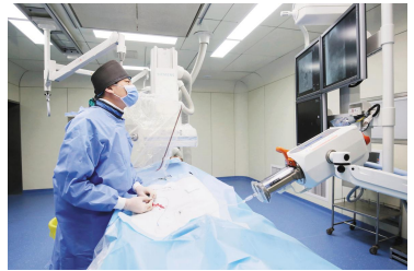
我院介入治疗中心自成立至今已有 15 年,是市内开展诊疗项目多、设备条件和技术水平高的临床科室之一。在肿瘤性疾病(如肝癌、肺癌、胰腺癌、胆管癌、胃癌、结肠癌以及转移性癌等)、下腔静脉滤器置入术、食管狭窄扩张术等介入微创综合治疗方面经验丰富。今后,医院介入治疗中心将以介入治疗为突破口,提高医疗质量,拓宽专业领域,推广前沿技术,引领学科发展,进一步推动我市肿瘤介入诊疗水平的提升,更好的为水城百姓健康服务。(冯晓丽)

治疗理念正发生变革,肿瘤治疗趋向微创、高效和个性化。微创介入正成为肿瘤治疗的新方向。介入治疗不仅可以挽救中晚期肿瘤患者生命,缓解病情,针对早期肿瘤患者,可达到根治的效果。日前,肿瘤介入与微创治疗已经成为与内科、外科并驾齐驱的第三大专科。它是在不开刀暴露病灶的情况下,在皮肤上作直径几毫米的微小通道,或通过人体原有的腔道,在 DSA 的引导下通过向肿瘤供血动脉内灌注化疗药物和栓塞剂,以“毒死”、“饿死”肿瘤。其局部药物浓度高,全身毒副作用小,真正达到微创治疗肿瘤的目的。而且除治疗恶性肿瘤外还可以治疗:股骨头坏死、腔道支架置入术、痔疮、静脉曲张、糖尿病足等疾病。具有微创性、定位准确、疗效高、见效快等优势。