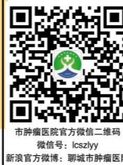
市肿瘤医院官方微信二维码 微信号: lcszlyy 新浪官方微博:聊城市肿瘤医院