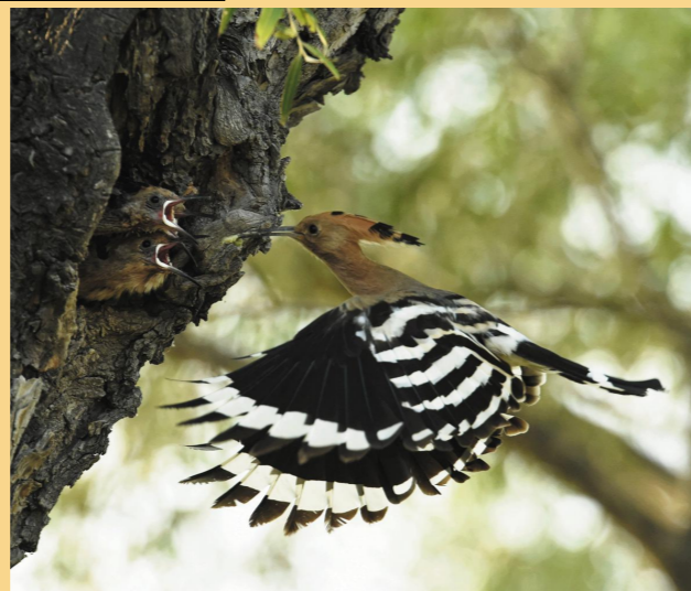
摄影作品:《啾啾待哺》