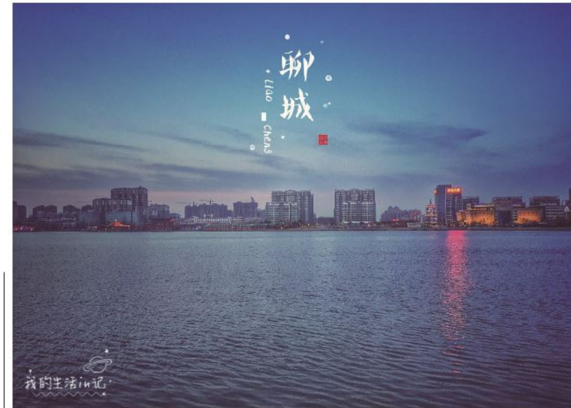
摄影作品:美丽水城我的家 作者:石文浩