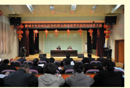
全体党员干部树立正确的政绩观、事业观,为实现造山东省一流品质专科医院的目标提供了强有力的保障。(王芳婷)

会议最后,杜保瑞副局长对此次动员大会进行了总结,他不仅充分肯定了这次大会的现实意义,也给出肿瘤医院群众路线教育实践活动的开展提出了新要求,他强调,医院全体党员干部要切实统一思想,学深、吃透各级指示的精神实质,要以上率下,领导带头,坚决纠正模糊认识,克服思想障碍,建立长效机制,扎紧制度笼子,按照动员讲话和实施方案,把活动开展好、落实好,做到“干部动真,群众动心”。这次动员大会,进一步促进了医院