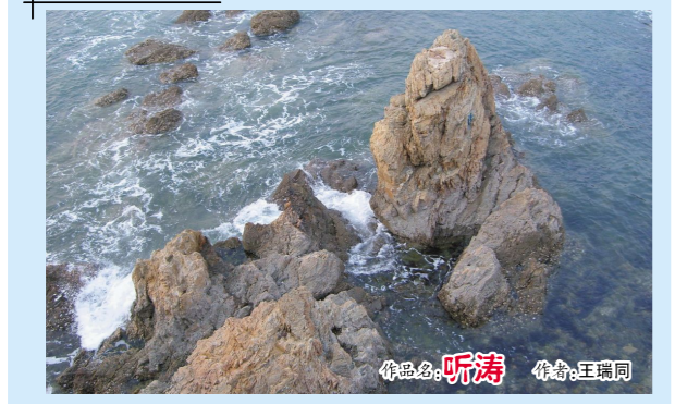
作品名:听涛 作者:王瑞同